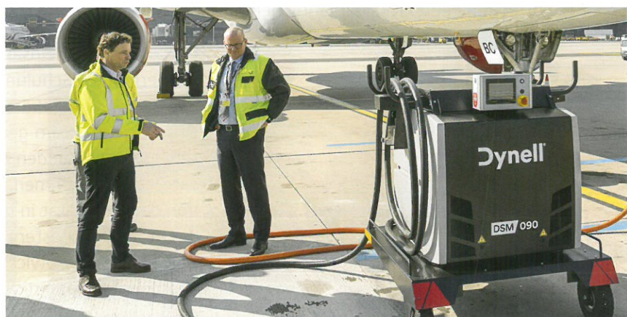
Die mobile Ground Power Unit wird mittels Unterflurstrom betrieben.